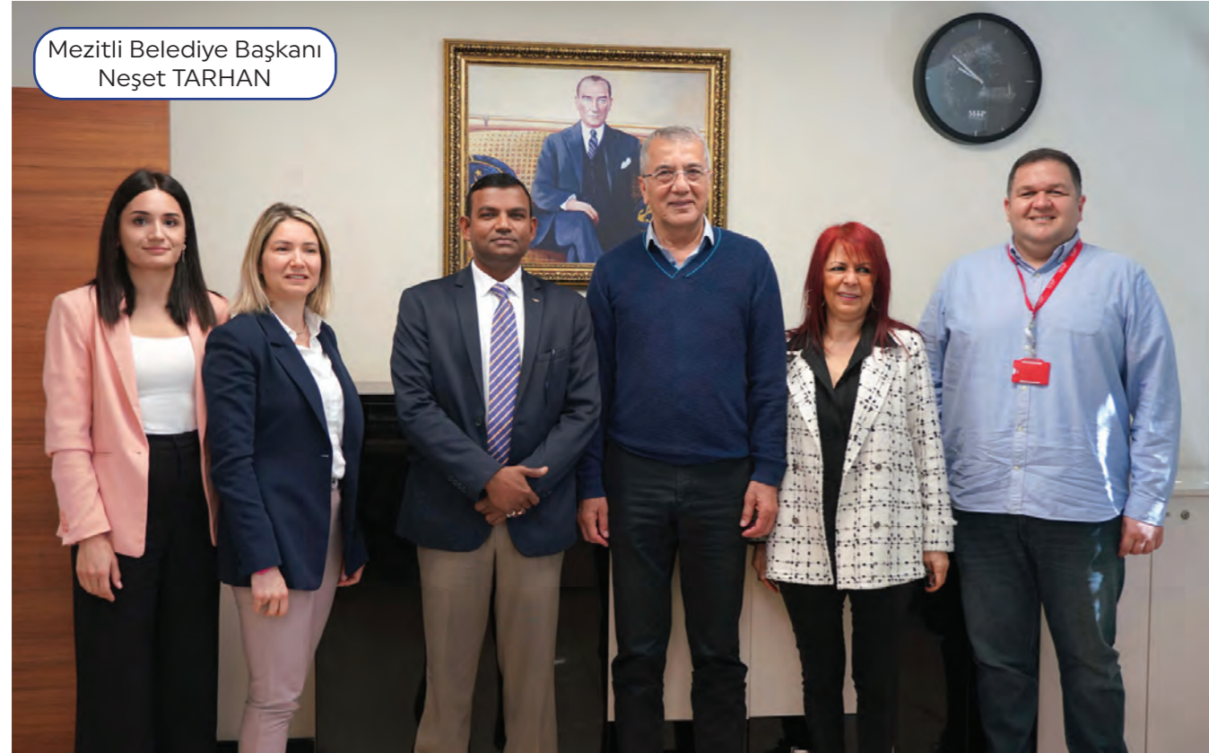
Mezitli Belediye Başkanı Neşet TARHAN