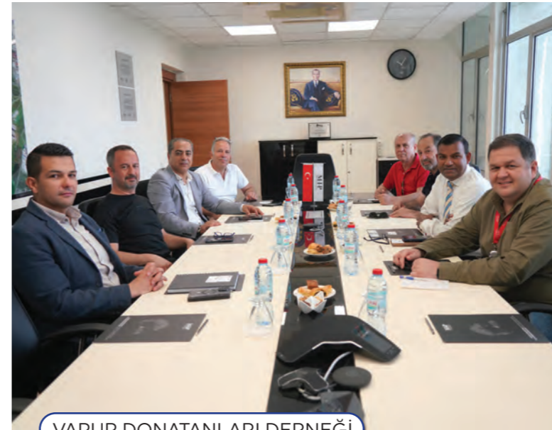
VAPUR DONATANLARI DERNEĞİ