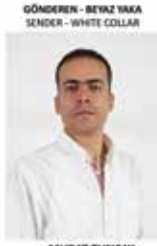
GÖNDEREN - BEYAZ YAKA SENDER - WHITE COLLAR

IT Saha Hizmetleri Yetkilisi - IT Field Services Technician