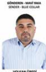
GÖNDEREN - MAVİ YAKA SENDER - BLUE COLLAR

Veri Saha Operasyon Uzmanı - Shift Operation Specialist