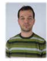
GÖNDEREN - MAVİ YAKA SENDER - BLUE COLLAR

Konvansiyonel Çargo Müdürlüğü Yürütme Yetkilisi Conventional Cargo Aiding Deputy Manager