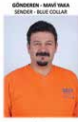
GÖNDEREN - MAVİ YAKA SENDER - BLUE COLLAR

IT Saha Hizmetleri Takım Lideri IT Field Services Team Leader