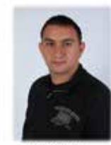
GÖNDEREN - BEYAZ YAKA SENDER - WHITE COLLAR