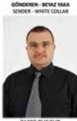
GÖNDEREN - BEYAZ YAKA SENDER - WHITE COLLAR

Dokümantasyon Yetkilisi - Documentation Agent