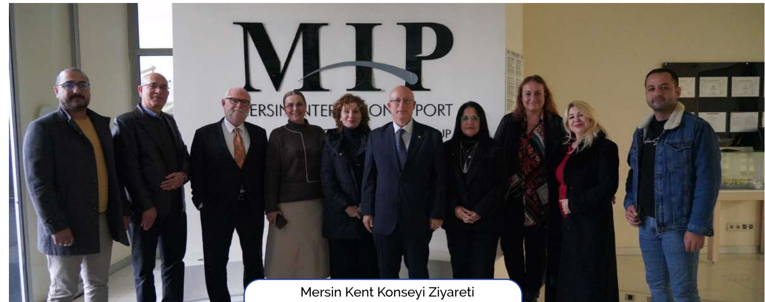
Mersin Kent Konseyi Ziyareti Mersin City Council Visit