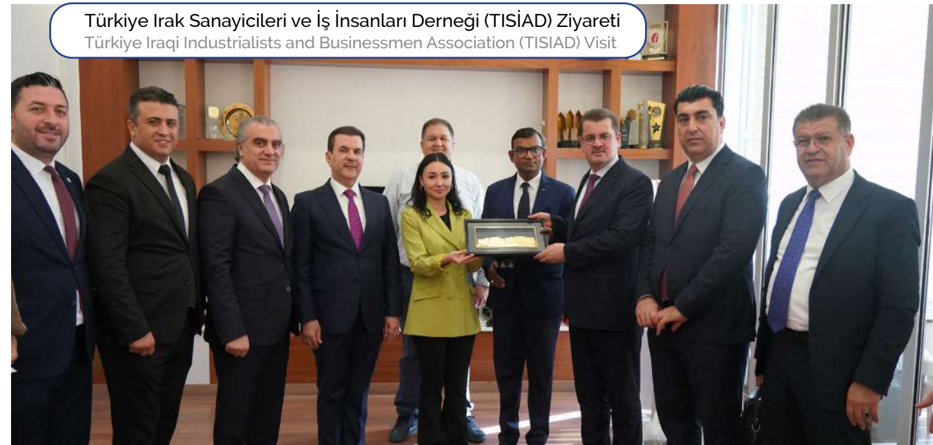
Türkiye Irak Sanayicileri ve İş İnsanları Derneği (TİSİAD) Ziyareti Türkiye İraqi Industrialists and Businessmen Association (TISIAD) Visit