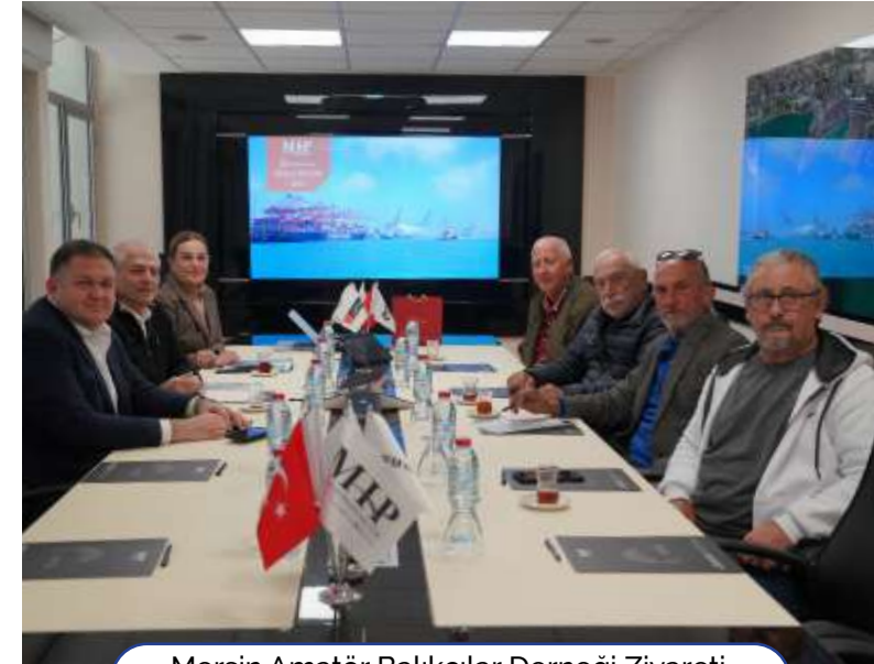
Mersin Amatör Balıkçılar Derneği Ziyareti Visit to Mersin Amateur Fishermen Association