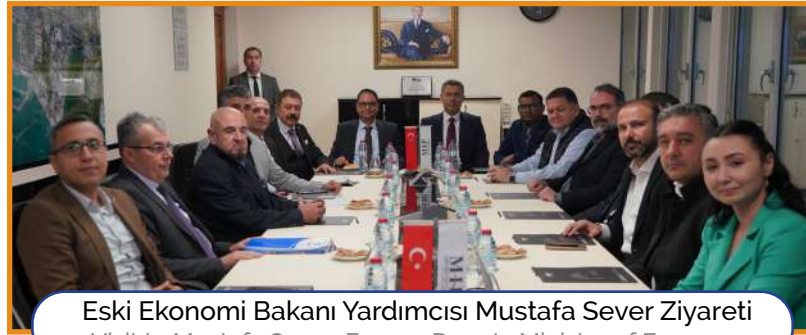
Eski Ekonomi Bakanı Yardımcısı Mustafa Sever Ziyareti Visit to Mustafa Sever, Former Deputy Minister of Economy

Our visitors received comprehensive information about our port's expansion projects and future investments. They were also informed about the operational processes, logistics infrastructure and environmental responsibilities of our port, and had an idea about MIP's role in the sector and its contributions to Mersin.