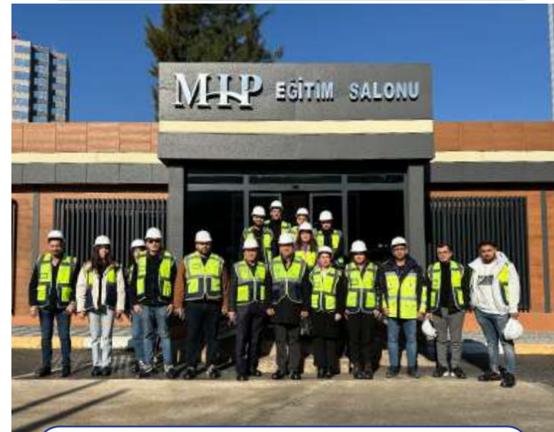
Toros Üniversitesi Uluslararası Lojistik Öğrencileri Ziyareti Toros University International Logistics Students