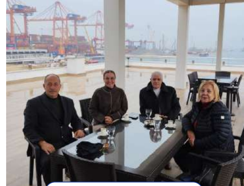
Akdeniz Belediyesi Muhtarlar Ziyareti Akdeniz Municipality Muhtars Visit