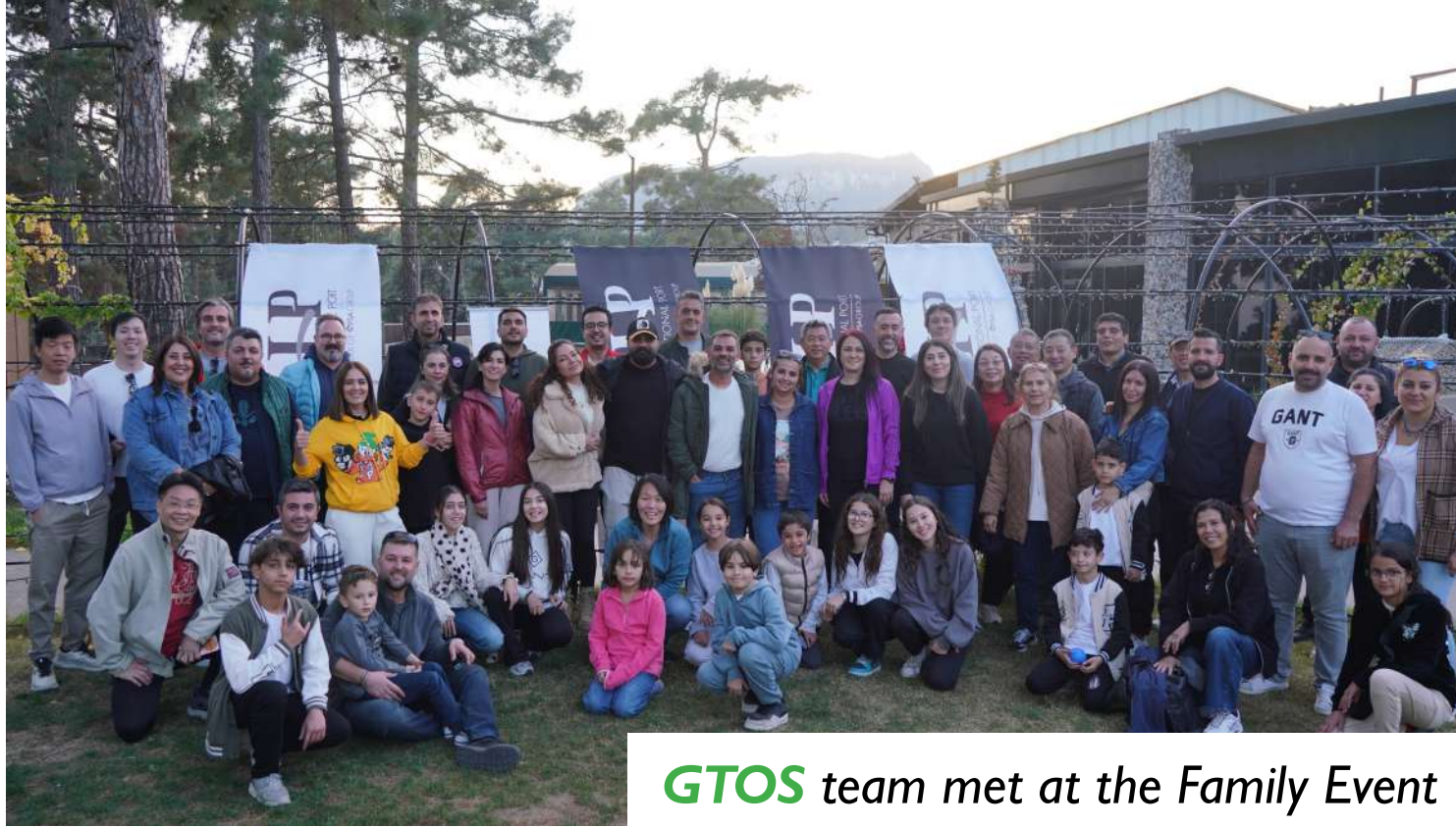
GTOS team met at the Family Event

Müşterilere sunduğumuz hizmetleri geliştirmek amacıyla başlayan Terminal İşletim Sistemi (TOS) iyileştirme çalışmaları devam ediyor.