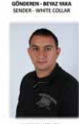
GÖNDEREN - BEYAZ YAKA SENDER - WHITE COLLAR