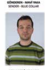
GÖNDEREN - MAVİ YAKA SENDER - BLUE COLLAR

Konvansiyonel Kargo Müdürlüğü Yönetim Yetkilisi Conventional Cargo Aiding Deputy Manager